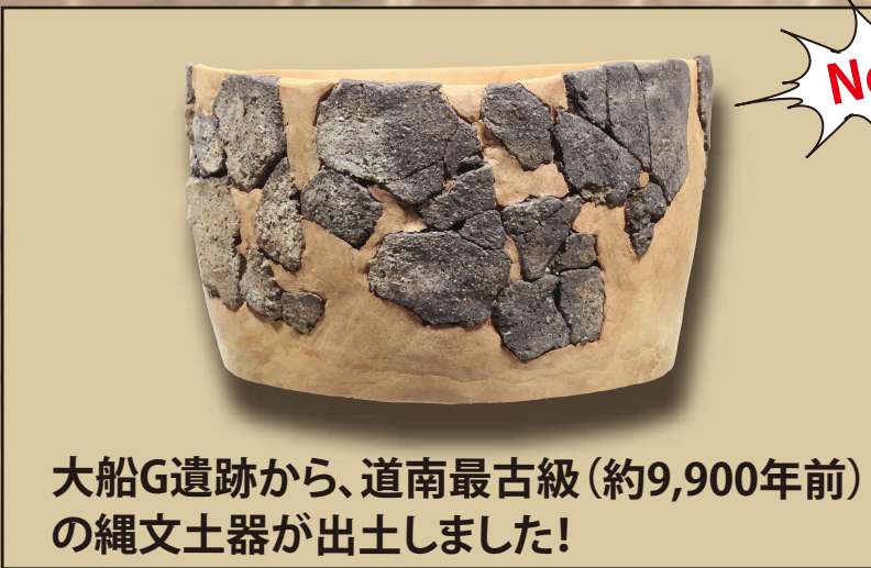
大船G遺跡から、道南最古級(約9,900年前)の縄文土器が出土しました!

令和5年度に発掘調査や整理作業を行った遺跡について、どんな成果や発見があったのか、実際に発掘調査を行った担当者がわかりやすく説明いたします。