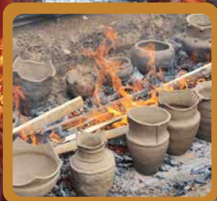
初回でつくった土器を縄文時代と同じように野焼きします。