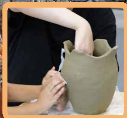
函館市内の縄文遺跡から出土した土器を見本に製作します。